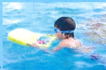
Piscine de Thoissey

Stage de Natation (à partir de 6ans) : (Débutant uniquement / Inscription à partir du 10 Juin)